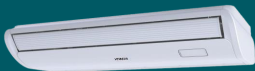
AR-CONDICIONADO PISO TETO