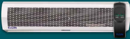
CORTINA DE AR