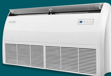
AR-CONDICIONADO PISO TETO